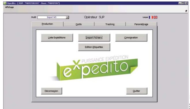
Captures d'écran de la station de travail Expedito utilisée par Manitou

Le top départ du projet est donné en mars 2014. Souhaitant monter en cadence transporteur par transporteur, le déploiement se termine en avril de la même année. Pourquoi avoir mis en œuvre Expedito ? « Nos transporteurs sont équipés de systèmes d'information (SI) différents. Les flux d'information le sont également. En outre, nous