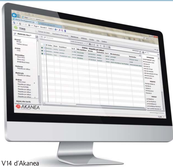
TMS V14 d'Akanea