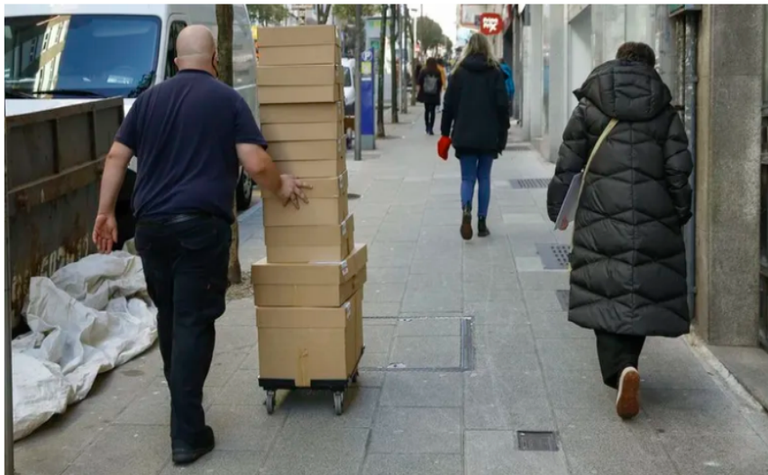
Un repartidor en Santiago, en foto de archivo.

Las ventas electrónicas movilizaron en el 2023 unos 84.000 millones de euros